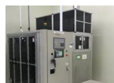
温水ラミネーター