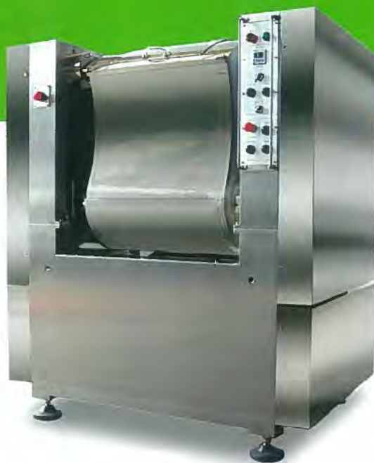
2袋用・3袋用ワナーミキサー