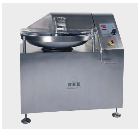
▲ ボウル容量50L、モーター11KW35A保護、インバータ15KW、重量730kg