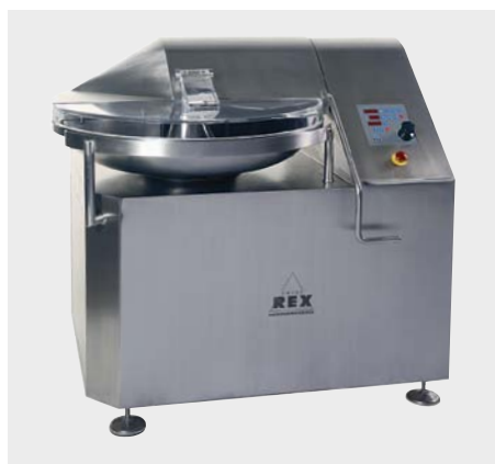
▲ ボウル容量70L、モーター22KW63A保護、インバータ22KW、重量1300kg